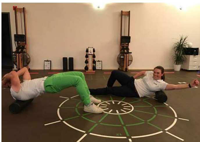
Foam roller : dos et épaules

N'hésitez pas à faire appel à un spécialiste TPI : une bonne mobilité, ça change le scénario, ça change le swing, et ça change la vie !