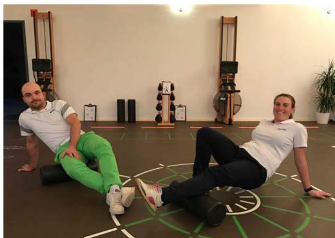
Foam roller : fessiers et mollets